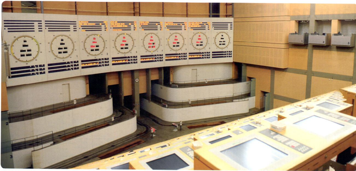
Auf dieses Uhrenpanorama werden die Kunden im Versteigerungssaal in Kürze blicken. Dabei werden die Waren, die über die beiden äußeren Uhren gehandelt werden, nicht mehr physisch an der Kundentribüne vorbeigefahren. Über den Uhren werden in Kürze noch Displays für die Darstellung von Produktbildern installiert.